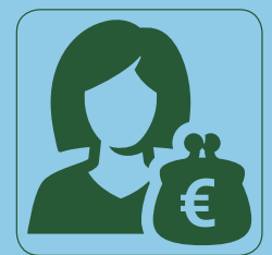
Zelf je zorg organiseren met een pgb